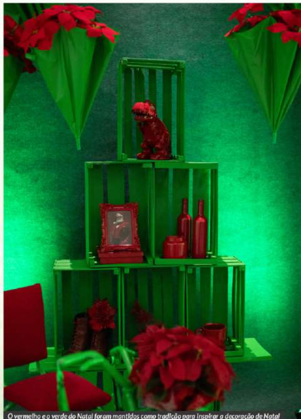
O vermelho e o verde do Natal foram mantidos como tradição para inspirar a decoração de Natal