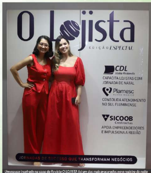
Um espaço inspirado na capa da Revista O LOJISTA foi um dos mais procurados para registro da noite